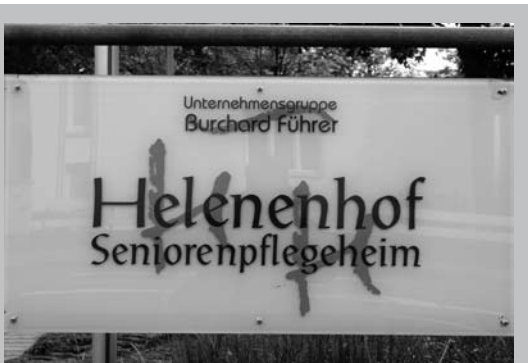
Von SPD und Grünen verkauftes Altenpflegeheim in Burgdorf.

und Bundesgesetze aufgedrückt. Bei allen Schwierigkeiten orientieren wir uns in der Kommunalpolitik an Schwerpunkten, die nicht verhandelbar sind. Dazu gehört die strikte Ablehnung von Privatisierungen. Diesem Grundprinzip folgend haben wir dem Verkauf der vier regionseigenen Altenpflegeheime in Burgdorf, Springe und Laatzen mit insgesamt 302 Pflegeplätzen die Rote Karte gezeigt. Der Verkauf ist und bleibt für uns eine skandalöse Entscheidung der Privatisierungsparteien, egal, ob sie SPD, Grüne, CDU oder FDP heißen. Denn der Privatisierungswahn hat viele Schattenseiten. Da die Verantwortlichen das öffentliche Ei-