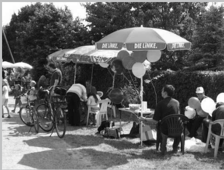
Mittlerweile Tradition: DIE LINKE beim „Fest unter der Eiche“.