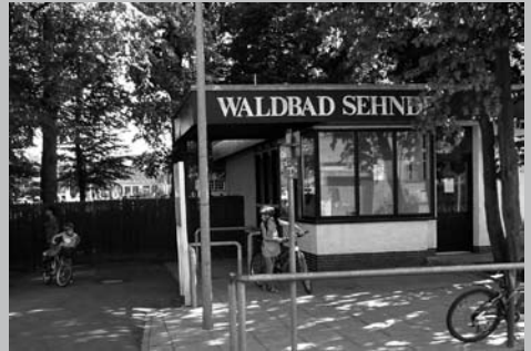
Das beliebte Waldbad in Sehnde sollte einem Kommerzbad mit hohen Eintrittspreisen weichen. Daraus wurde aber nichts.

möglich den Badespaß einiger Erwachsener beeinträchtigt. Über dem Hauptschwimmbecken fehlen auch die Bäume, die die kleinsten Besucher vor der Sonne schützen und dem Bad seinen Namen gegeben haben. Aber damit war das Thema noch nicht vom Tisch, denn irgendwie waren auch CDU und FDP nicht richtig mit ihrer Entscheidung zufrieden. Also setzten sich noch einmal alle Parteien an einen Tisch und suchten nach Alternativen. Schließlich kam jemand auf die Idee, ein Fachbüro mit dieser Aufgabe zu betrauen – und das hat sich in Heller und Pfennig für die Stadt gerechnet. Die Experten empfehlen der Kommune, die erst wenige Jahre alte Technik des HauptschwimmbECKENS auch für das Kinderplanschbecken zu nutzen. Dadurch sinken die Renovierungskosten für das Planschbecken auf rund 130.000 Euro. Damit können selbstverständlich alle Fraktionen leben. Das Planschbecken bleibt also, wo es ist, unter den Bäumen und kann wie das übrige Waldbad saniert werden.