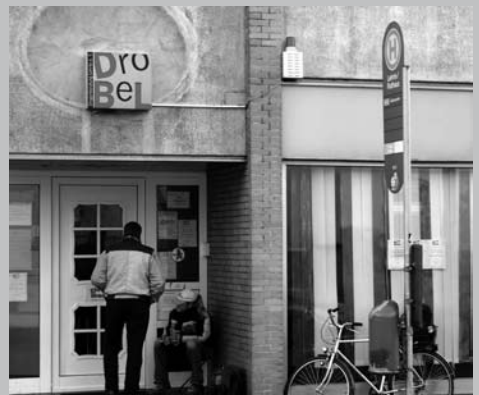
Die Drogenberatungsstelle Drobelt hat wegen Geldmangels viel zu kurze Öffnungszeiten. Mit einem Bürgerhaushalt würde sich das ändern.