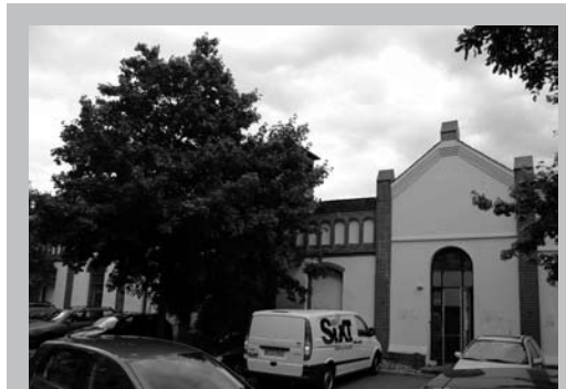
Im Ökologischen Gewerbehof Linden entstehen zukunfts-sichere Arbeitsplätze.

Die Jobcenter müssen so gestaltet sein, dass sie nicht nur bundesweit einheitliche Lebensbedingungen für Arbeitslose sicherstellen. Gleichzeitig müssen sich auch lokale Erfahrungen und Kompetenzen entfalten können, wenn es um Jobs und Qualifizierungsmaßnahmen geht. Dabei dürfen die Betroffenen keinen Zwängen und Schikanen ausgesetzt sein. Da die große Koalition noch keine Regelung über die Zukunft der Jobcenter getroffen hat, beginnt sich dort allerdings Stillstand auszubreiten: Statt Arbeitslosen sinnvolle Qualifizierungs- und Jobangebote zu machen, suchen die MitarbeiterInnen das Weite. Viele haben nur befristete Verträge oder sind verunsichert, was sie tun sollen. Die Leidtragenden dieses staatlich verordneten Nichtstuns sind die Arbeitslosen. Sie müssen schon froh sein, wenn die ihnen zustehenden Gelder pünktlich auf dem Konto eintreffen. Zu dieser Situation hat sicher auch der Streit zwischen Bundesagentur und Region um die Geschäftsführung bei den Jobcentern beigetragen. Das Hauptproblem liegt aber beim Bund.