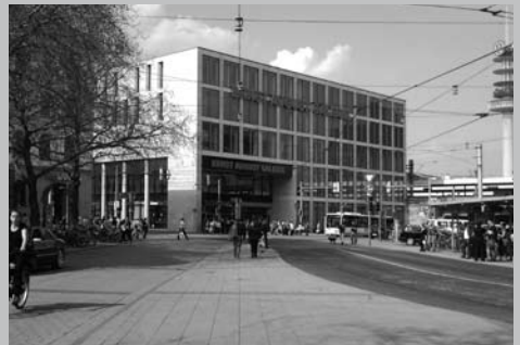
Stadtbezirk Mitte: Schöne neue Einkaufswelt?

Die zentrale Lage, die Infrastruktur und die persönlichen Lebensumstände sind hier offenbar befriedigend genug, um die Oststädter in einer gewissen Behäbigkeit verharren zu lassen. Findet Engagement statt, richtet es sich auf die kleinräumige Gestaltung des eigenen Wohnumfeldes, beispielsweise auf die Erlaubnis zur Aufstellung eines von AnwohnerInnen finanzierten Zaunes um einen Spielplatz.