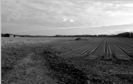
Unter diesen Wiesen und Äckern lagert das Burgdorfer Trinkwasser. Der Rat gibt viel Geld, um hier Gewerbe anzusiedeln.

Was sich wie eine Szene aus einem schlechten Film anhört, ist in Burgdorf Realität: Der Rat hat beschlossen, ein großes Gewerbegebiet mitten im Trinkwasser-Gewinnungs-Gebiet des Burgdorfer Wasserwerks anzusiedeln. Nur DAS LINKSBÜNDNIS stimmte dagegen. Die große Mehrheit folgte damit den Interessen örtlicher Wirtschaftsvertreter. Auf der Strecke bleiben im Zweifel nicht nur der Trinkwasserschutz, sondern auch die Finanzen der Stadt. Das sogenannte Gewerbegebiet Nordwest kostet viele Millionen – Geld, das woanders fehlt. Allein der Ankauf der erforderlichen Grundstücke schlug mit rund 5 Mio. Euro zu Buche. Hinzu kommen demnächst 2,7 Mio. Euro für Kanalisation, Straßen und Beleuchtung. Von den mehr als 7 Mio. Euro werden rund 4 Mio. Euro mit Krediten bezahlt. Wegen der Wirtschaftskrise wird die Stadt die Grundstücke nicht los und sitzt nun, zusammen mit den einbrechenden Steuereinnahmen, auf einem Haufen Schulden.