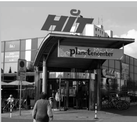
Das von der Schließung bedrohte Planetencenter liegt vor der Haustür vieler Garbsener im Stadtteil Auf der Horst.