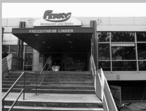
Auch über den Stadtteil hinaus von Bedeutung: Die Stadtteilbibliothek im Freizeithaus Linden.

Mehrheit von einer Stimme (seiner eigenen) bei geschlossener Enthaltung aller anderen Mitglieder des Gremiums angenommen. Offensichtlich wollten die anderen Fraktionen sich nicht die Blöße geben, den Antrag offen abzulehnen, wollten aber auch keine gemeinsame Sache mit dem linken Bezirksratsmitglied machen. „Der Rat der Landeshauptstadt Hannover wird aufgefordert, die per Ratsbeschluss im Jahr 2004 mit dem Haushaltssicherungskonzept 2005 bis 2007 (HSK V) beschlossene Maßnahme Zusammenlegung von Bibliotheksstandorten in Linden zurückzunehmen und die Verwaltung anzuweisen, die Umsetzung der Maßnahme umgehend zu stoppen“, so der Beschluss im O-Ton.