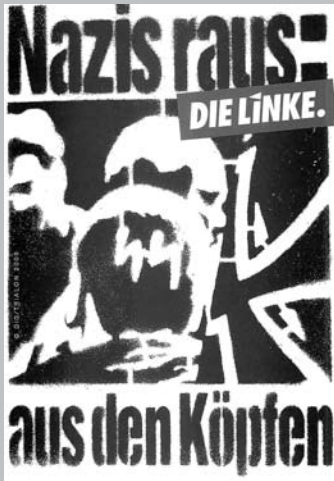
Auch im Stadtbezirk ein wichtiges Thema: Antifaschismus.

welche allerdings von den anderen Parteien abgelehnt wurde. „Was die Landeshauptstadt Hannover schon beschlossen hat, braucht der Bezirksrat nicht mehr nachzuholen“, lautete die Begründung der Sozialdemokraten; die CDU vermisste den Hinweis auf den „Linksextremismus“. Um so mehr freute sich Seidel, als eine interfraktionelle Resolution des Bezirksrates Ahlem-Badenstedt-Davenstedt das vom DGB initiierte Bündnis gegen den von den Nazis am 1. Mai 2009 in Hannover geplanten Aufmarsch Formulierungen seines 2007 gestellten (und damals abgelehnten) Antrages enthielt. So etwa die Textzeile: „Die Mitglieder und Fraktionen im Stadtbezirksrat Ahlem-Badenstedt-Davenstedt wenden sich gegen jegliche Form von Rassismus, Fremdenfeindlichkeit und Rechtsextremismus.“