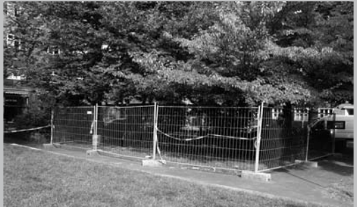
Absperrungen auf dem De-Haen-Platz in der List: Radioaktive Rückstände direkt unter der Wohnbebauung.

Eine besonders gravierende Altlast ist das ehemalige de-Haën-Gelände in Hannover-List, wo seit rund 100 Jahren chemische und radioaktive Rückstände unter einer Wohnbebauung lagern. In enger Kooperation mit der Bürgerinitiative und durch politischen Druck der LINKEN ist es zumindest gelungen, dass die Regionsverwaltung die Sanierungskosten zunächst von dem de-Haën-Rechtsnachfolger, dem Honeywell-Konzern einzutreiben versuchte. Als Option halten sich Regionsverwaltung, SPD, Grüne und CDU aber den finanziellen Rückgriff auf die WohnungseigentümerInnen offen. Ein Antrag der LINKEN Regionsfraktion, der neben Honeywell auch Verantwortlichkeiten der Landeshauptstadt und der kommunalen Wohnungsbaugesellschaften wegen deren möglicher Kenntnis der Gefahrensituation vor den Wohnungsverkäufen benennt, wurde in der Regionsversammlung im Juni 2009 von Rot-Grün abgeschmettert – nur die FDP (!) unterstützte ihn.