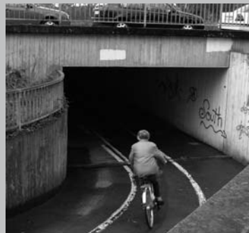
RadlerInnen müssen auf einer wichtigen Strecke zwischen City und Weststadt in der Kurve in ein dunkles Loch fahren.