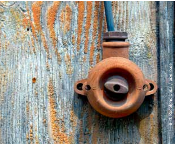
Digitale Anwendung von gestern.

D as digitale Lernen an Schulen beschäftigt derzeit die Politik im Stadtbezirksrat Buchholz-Kleefeld. Es geht um schnellere Internetzugänge und den Ausbau der