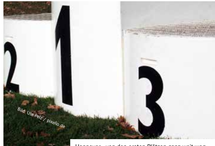
Hannover - von den ersten Plätzen ganz weit weg.